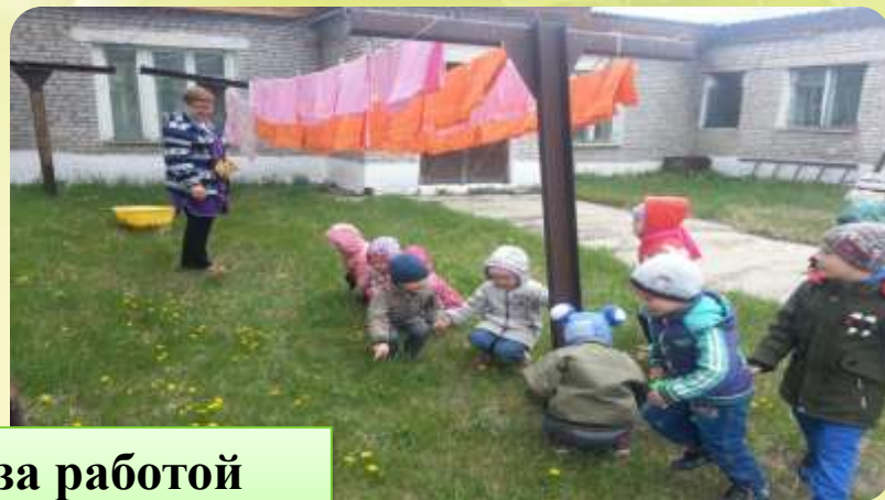
Наблюдение за работой прачечной