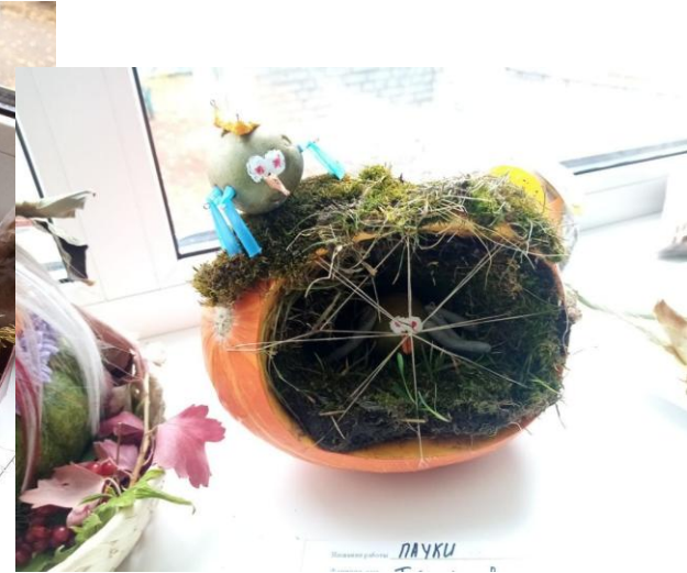
Творческий конкурс "Осенние превращения"