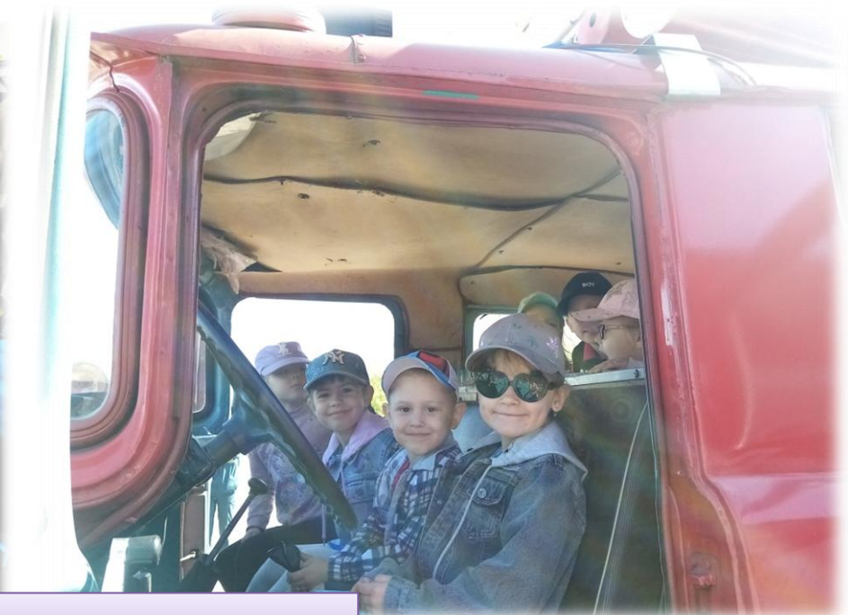
Экскурсия в пожарную часть