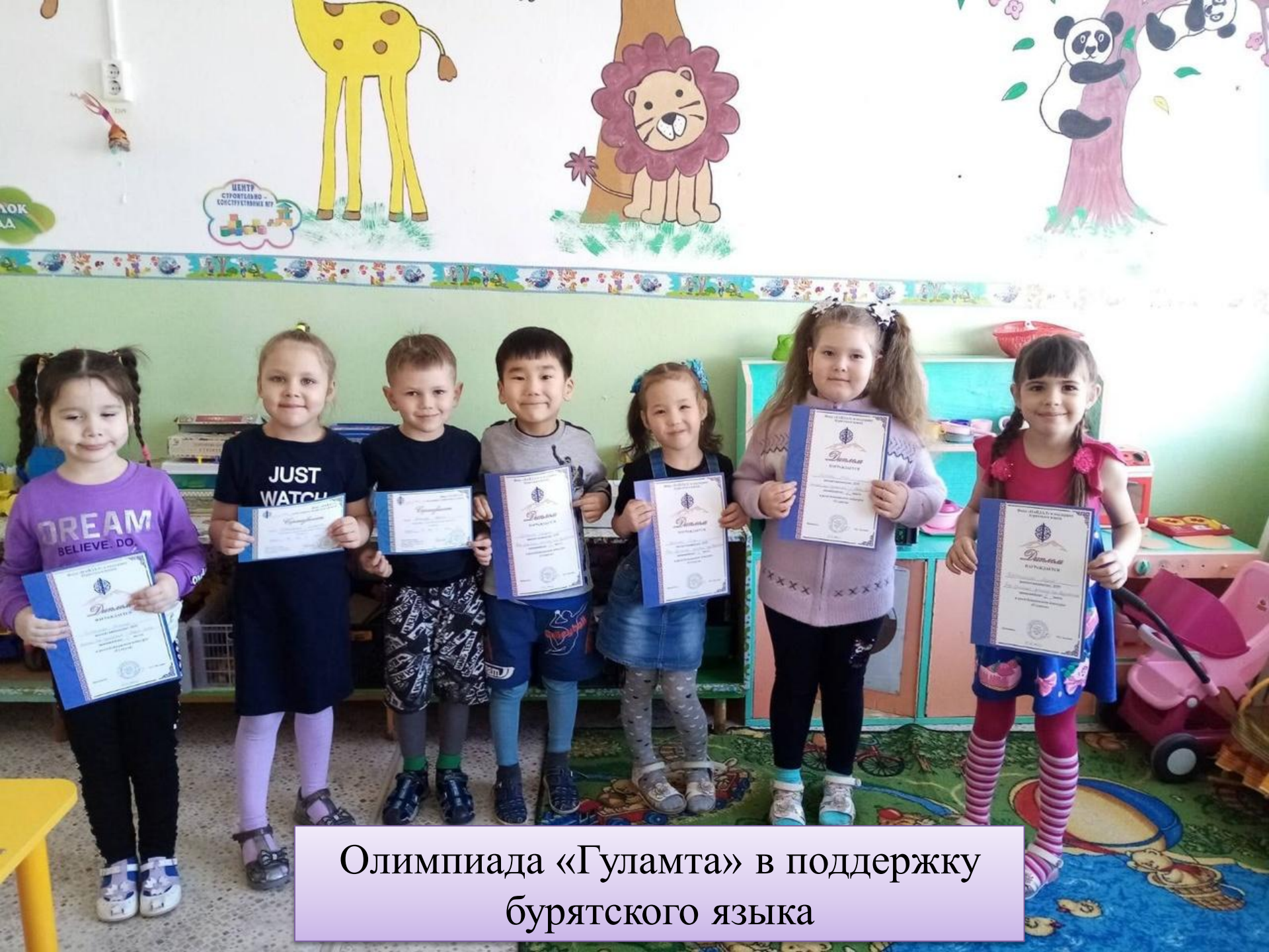
Олимпиада «Гуламта» в поддержку бурятского языка