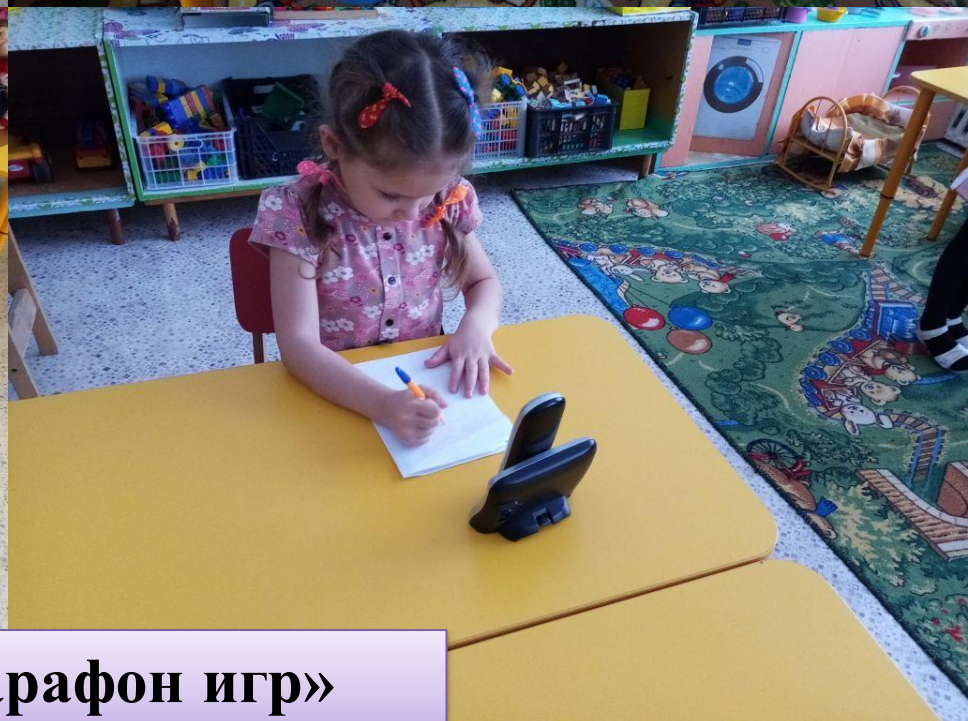
Проект «Марафон игр»