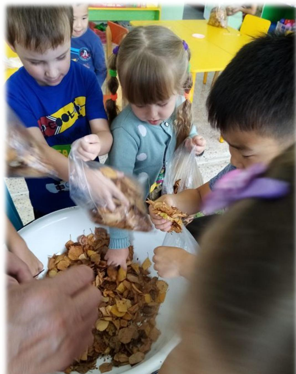
Конструирование из природного материала "Сова"