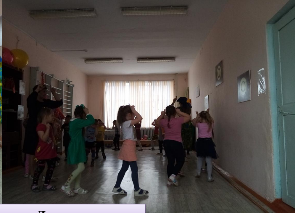
Развлечение «День земли»