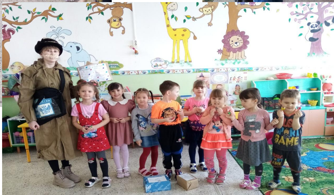
Развлечение «Почтальон Печкин в гостях у ребят»