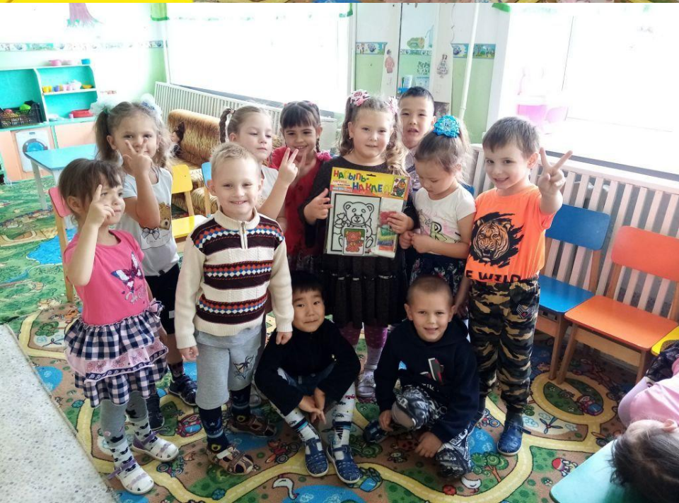
Празднуем дни рождения, дарим подарки