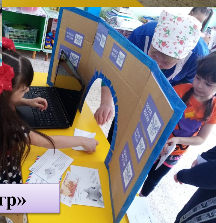
Проект «Марафон игр»