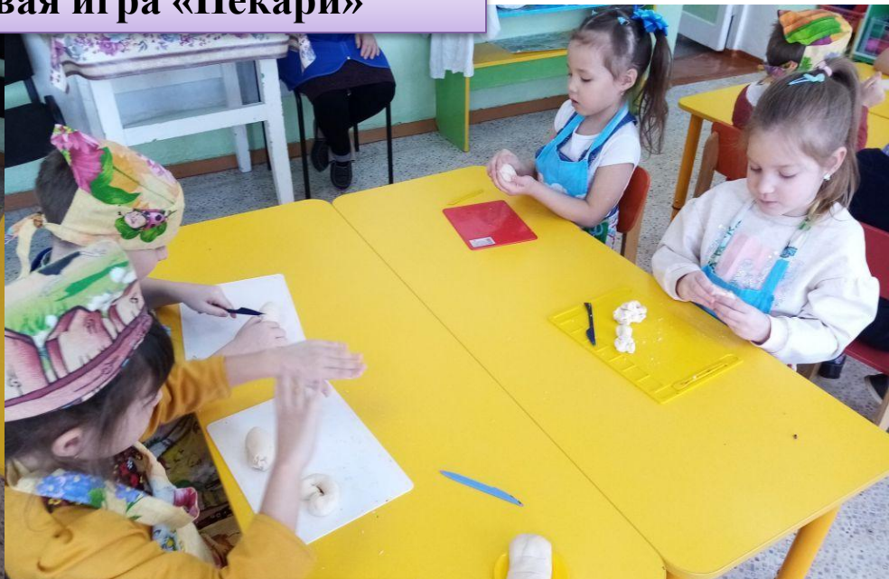
Проект «Марафон игр»