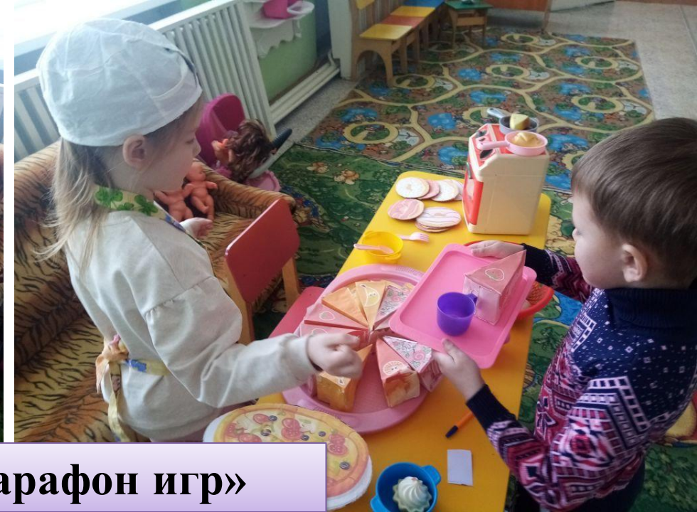
Проект «Марафон игр»