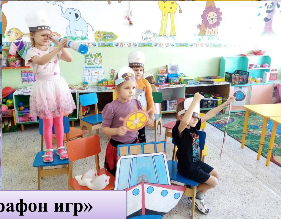
Проект «Марафон игр»