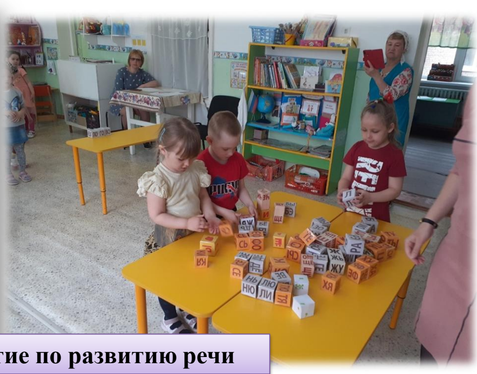
Открытое занятие по развитию речи