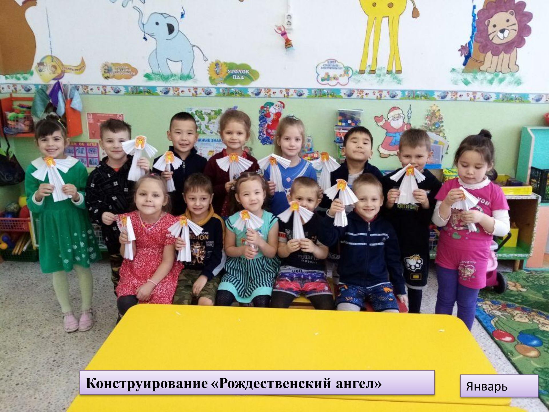
Конструирование «Рождественский ангел»