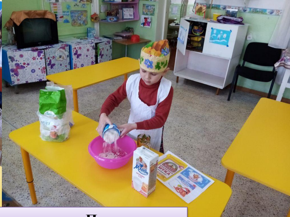
Сюжетно-ролевая игра «Пекари»