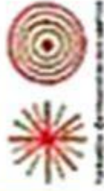
узоры с геометрическими фигурами