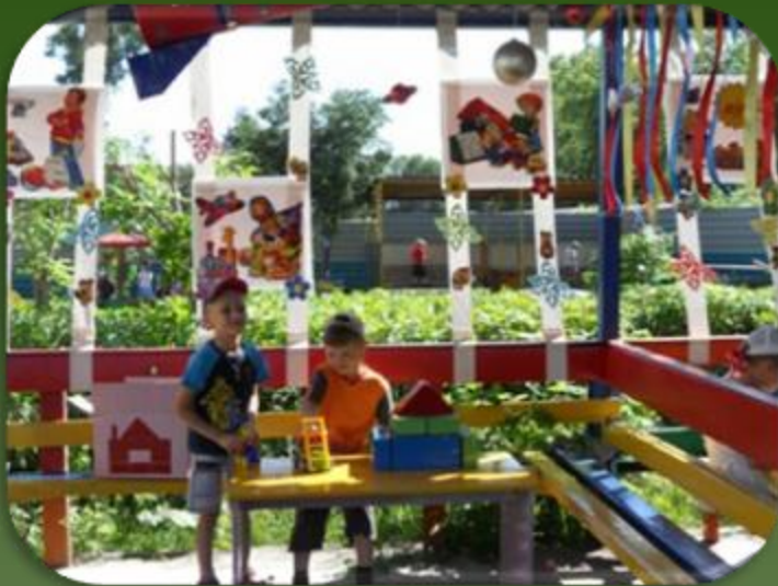
«Дом царицы Математики»