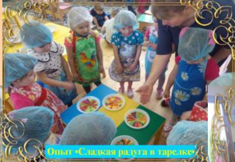
Опыт «Сладкая радуга в тарелке»