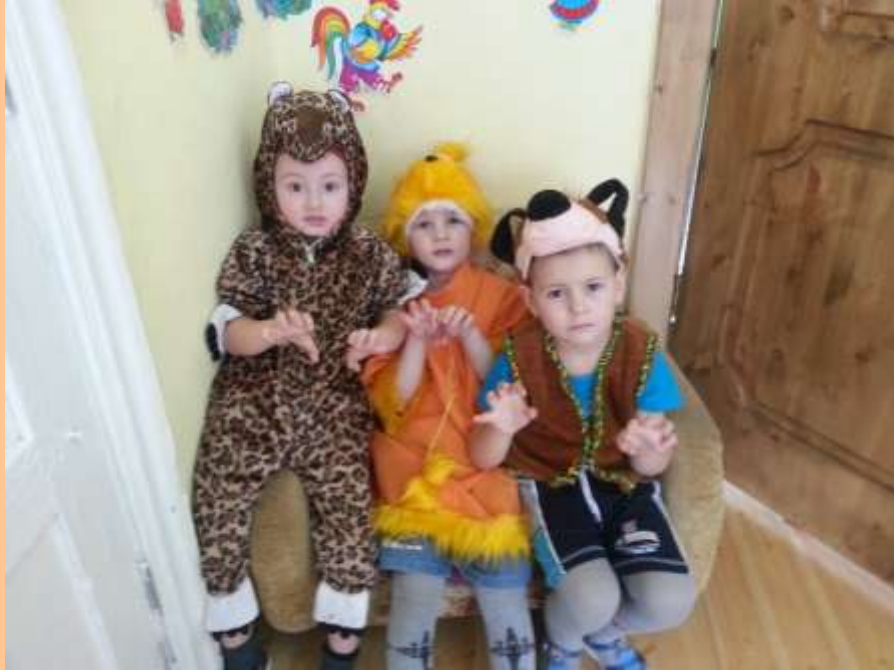
Мы веселые артисты,