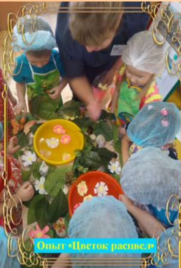
Опыт «Цветок расцветает»