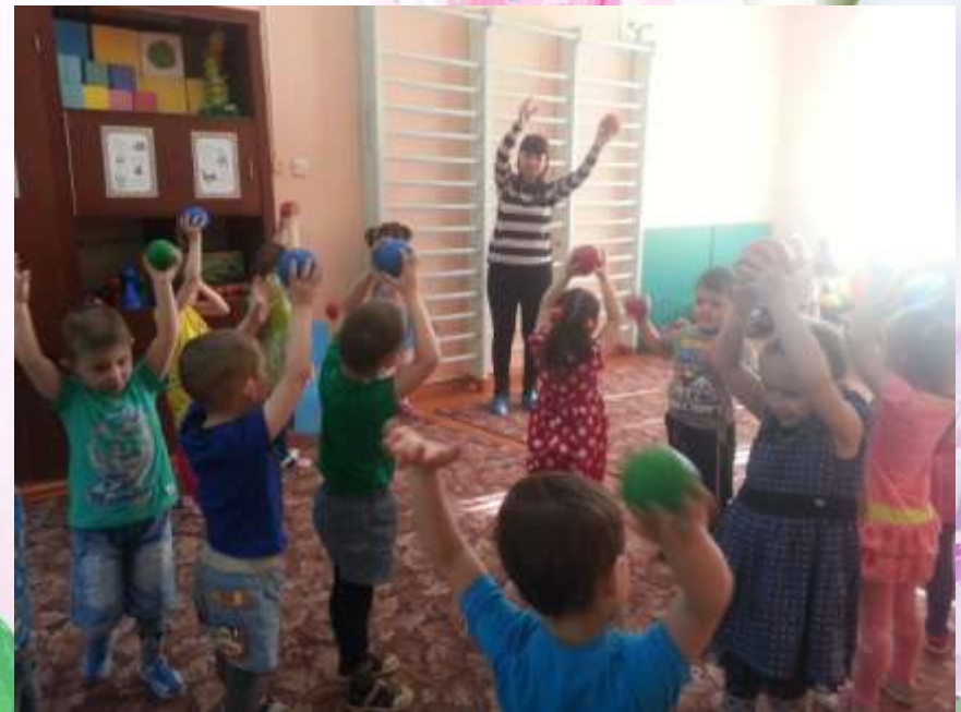
День открытых дверей