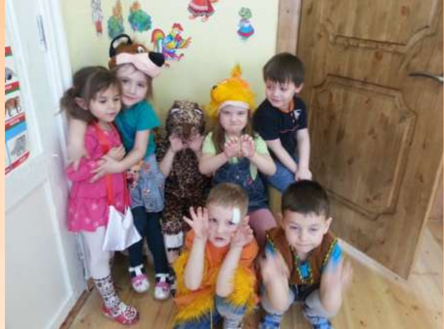
Любим сказки и кино!