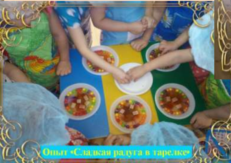
Опыт «Сладкая радуга в тарелке»