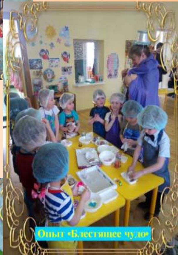
Опыт «Блестящее чудо»