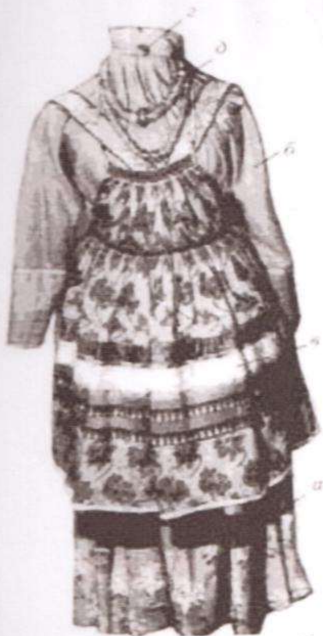
а — сарафан, б — рубаха, в — запон, г. — запонка, д — янтарины