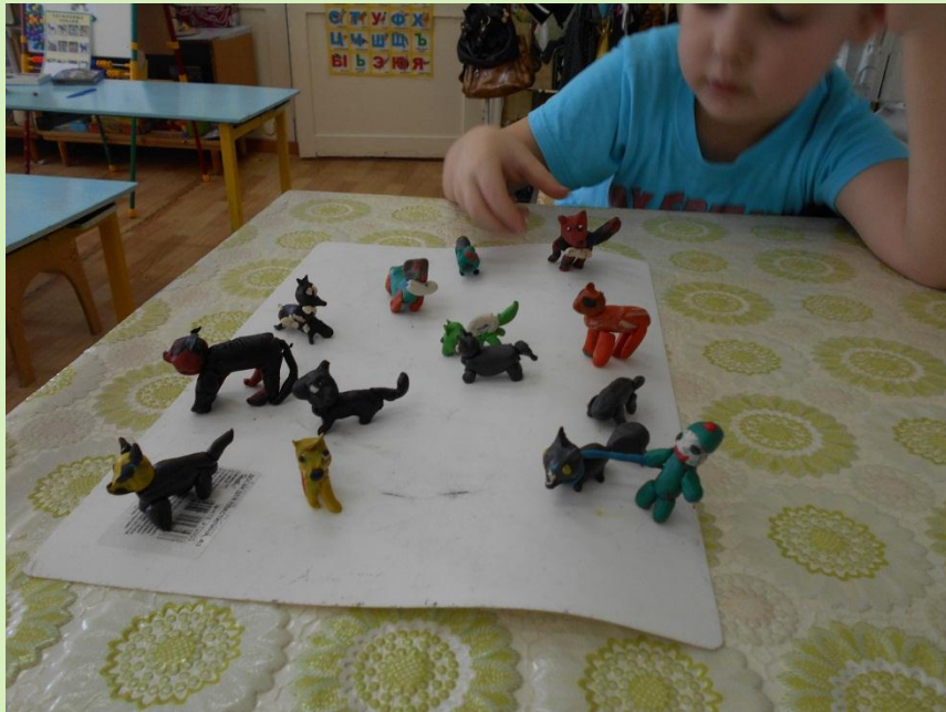
Лепка «Пограничник с собакой»